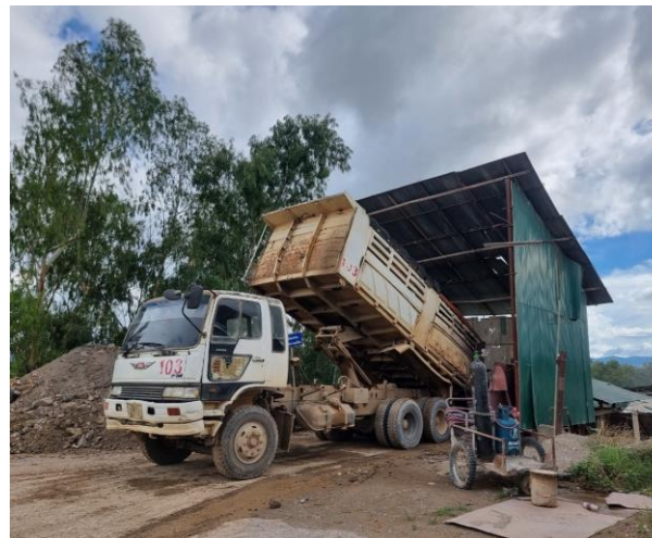
รูปที่ 2-19 (ต่อ) ดินไม้โดยรอบพื้นที่โรงไม้หิน