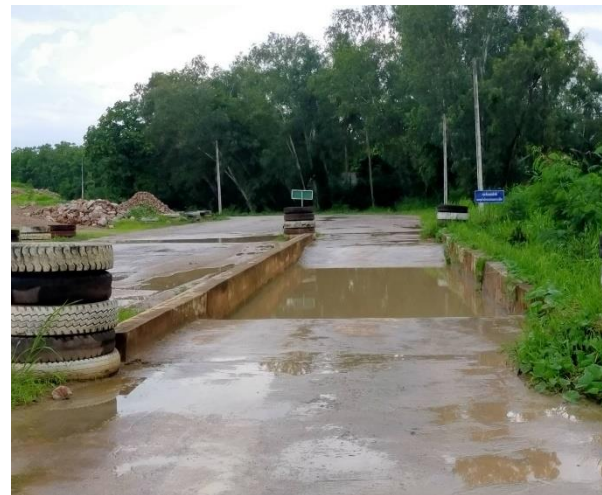
รูปที่ 2-30 รางล้างล้อรถของโครงการ