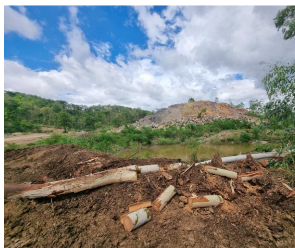
รูปที่ 2-9 บ่อดักตะกอนในโครงการ