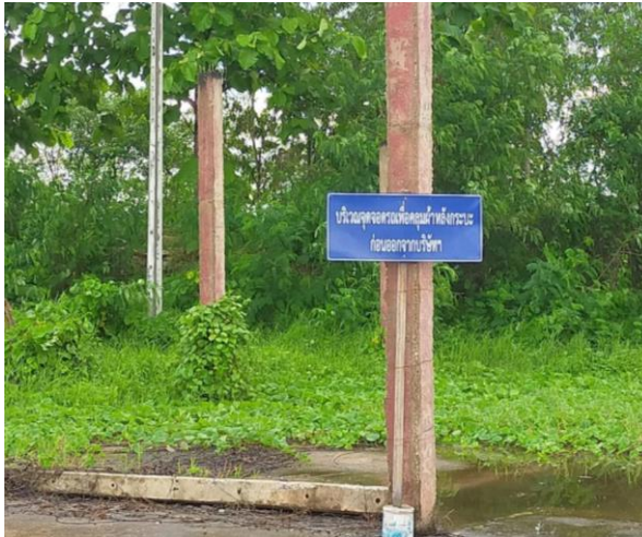
รูปที่ 2-22 จุดปิดคลุมกระบะบรรทุกของโครงการ