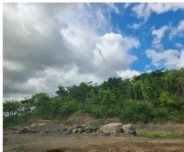
รูปที่ 2-13 (ต่อ) การปลูกต้นไม้บริเวณที่ว่างในโครงการ