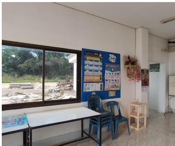
รูปที่ 2-1 สำนักงานโครงการที่มีเจ้าหน้าที่คอยรับเรื่องร้องเรียน