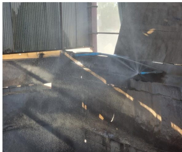
รูปที่ 2-5 (ต่อ) การปิดคลุมสายพานและติดตั้งระบบสเปรย์น้ำ