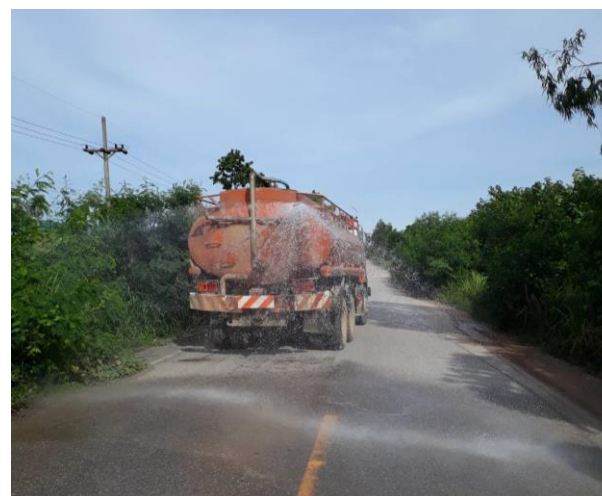
รูปที่ 2-31 (ต่อ) การฉีดล้างถนนลาดยางที่เป็นเส้นทาง ขนส่งแร่