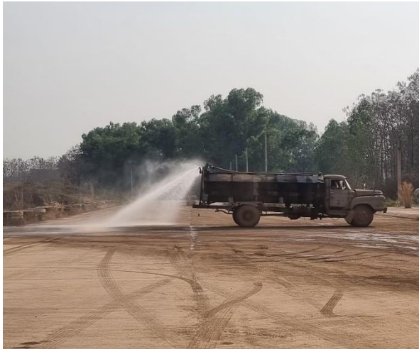
รูปที่ 2-18 การฉีดพรมน้ำในพื้นที่โครงการเพื่อป้องกันการฟุ้งกระจายของฝุ่นละออง (ภาพกิจกรรมล่าสุด)