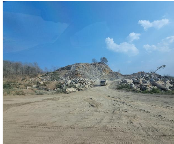
รูปที่ 2-12 ถนนในโครงการ