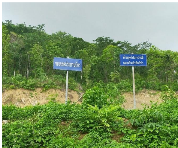
รูปที่ 2-2 (ต่อ) แนวสัญลักษณ์แสดงพื้นที่ในโครงการ