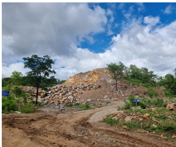
รูปที่ 2-4 พื้นที่หน้าเหมืองของโครงการ