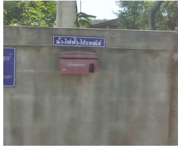
รูปที่ 2-28 (ต่อ) การติดตั้งกล่องรับฟังความคิดเห็น บริเวณชุมชน (ภาพกิจกรรมล่าสุด)