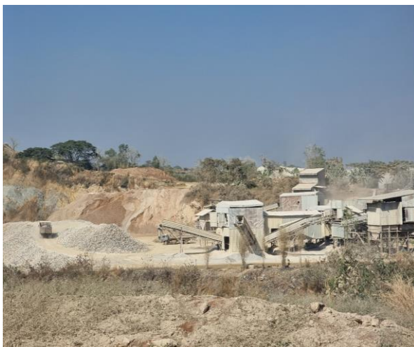
รูปที่ 2-5 โรงโม่หินของโครงการที่มีการปิดคลุม