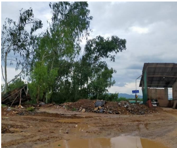
รูปที่ 2-19 ดินไม้โดยรอบพื้นที่โรงไม้หิน