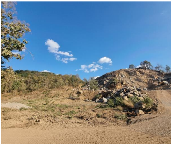
รูปที่ 2-24 หน้าเหมืองที่ทำตามที่แผนผังโครงการกำหนด