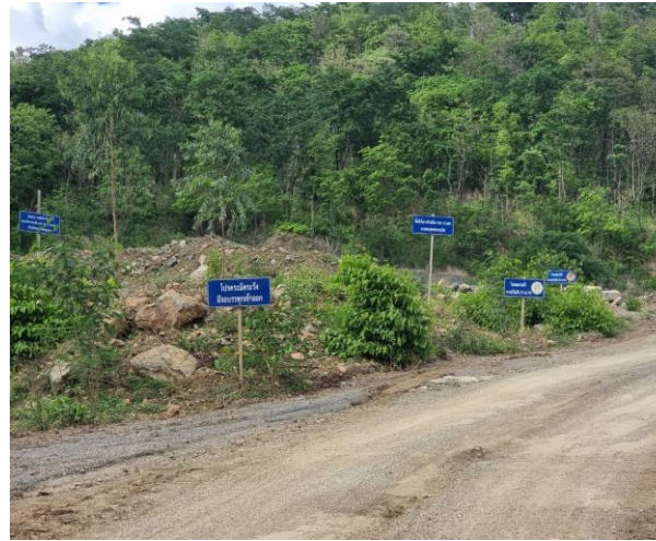
รูปที่ 2-10 (ต่อ) คั่นทำนบดินของโครงการ