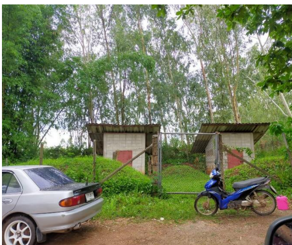
รูปที่ 2-6 ที่เก็บวัสดุระเบิด