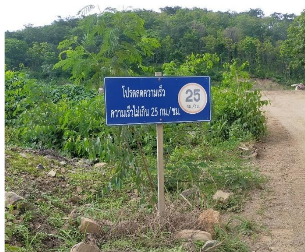
รูปที่ 2-21 ป้ายจำกัดความเร็ว 25 กม/ชม