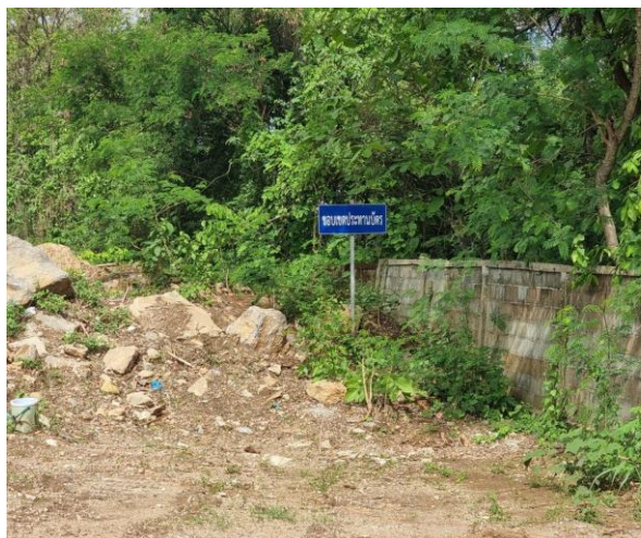
รูปที่ 2-2 แนวสัญลักษณ์แสดงพื้นที่ในโครงการ