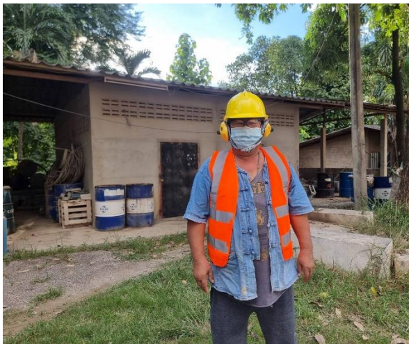
รูปที่ 2-29 การสวมใส่อุปกรณ์ป้องกันอันตรายส่วนบุคคล