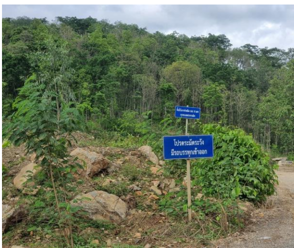
รูปที่ 2-26 ป้ายเตือนเรื่องการลดความเร็วในการขับรถ