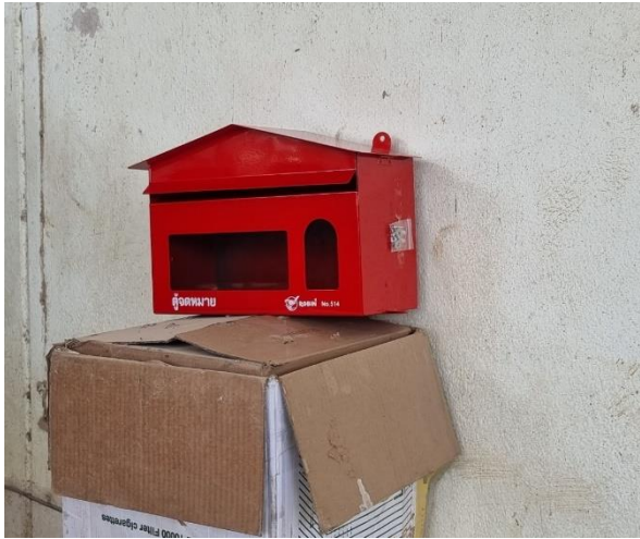
รูปที่ 2-28 การติดตั้งกล่องรับฟังความคิดเห็น บริเวณสำนักงาน (ภาพกิจกรรมล่าสุด)