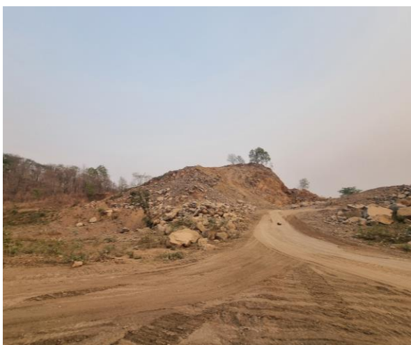
รูปที่ 2-20 ถนนในโครงการที่มีการดูแลเป็นอย่างดี