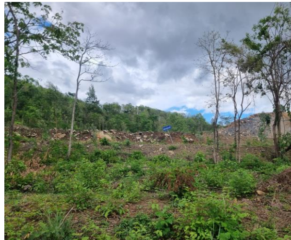
รูปที่ 2-16 (ต่อ) ไม้ยืนต้นในโครงการ