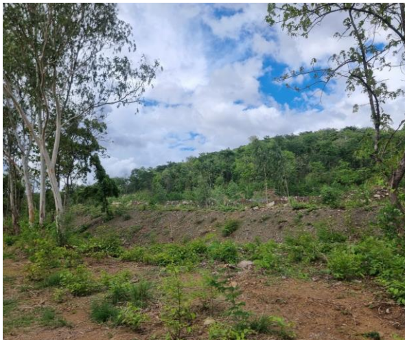
รูปที่ 2-16 ไม้ยืนต้นในโครงการ