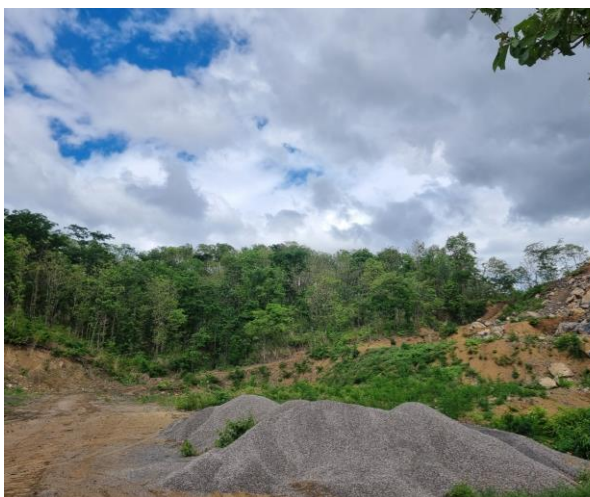
รูปที่ 2-13 พื้นที่ที่ไม่เกี่ยวข้องกับการทำเหมือง