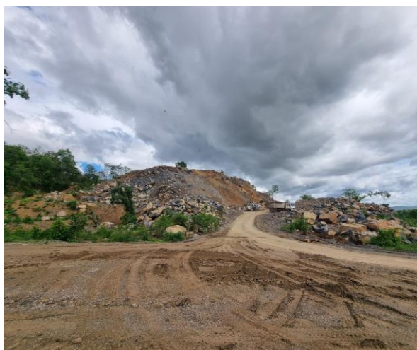
รูปที่ 2-4 (ต่อ) พื้นที่หน้าเหมืองของโครงการ