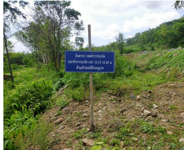
รูปที่ 2-23 ป้ายแจ้งเตือนเขตการใช้ระเบิดและเวลาในการระเบิด 16.15-16.24 น.