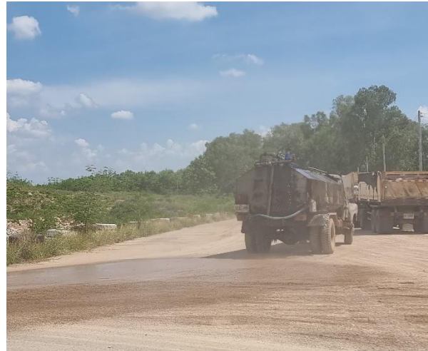
รูปที่ 2-18 (ต่อ) การฉีดพรมน้ำในพื้นที่โครงการเพื่อป้องกันการฟุ้งกระจายของฝุ่นละออง (ภาพกิจกรรมล่าสุด)