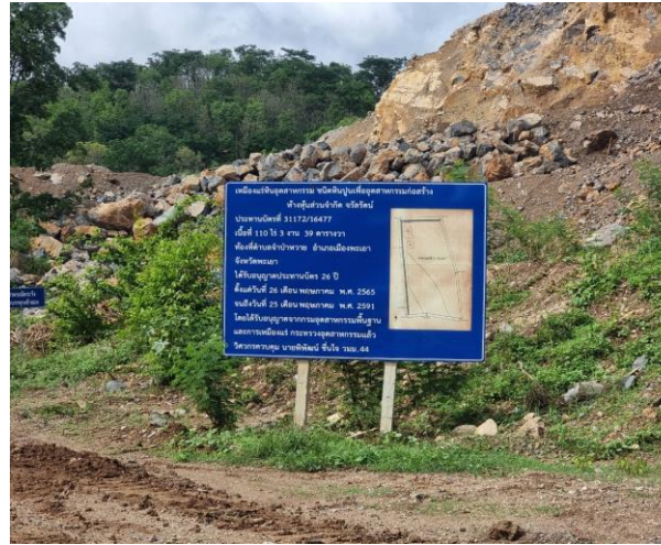
รูปที่ 2-15 ป้ายแสดงข้อมูลเกี่ยวกับโครงการ