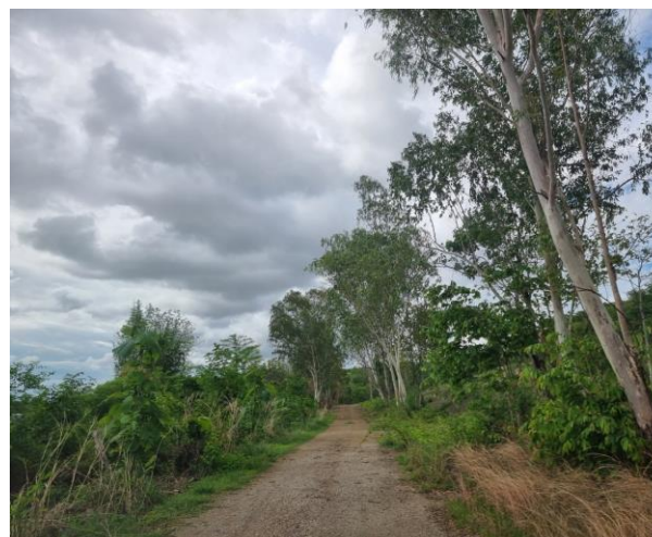
รูปที่ 2-17 (ต่อ) ต้นไม้ที่ปลูกริมถนนในโครงการ