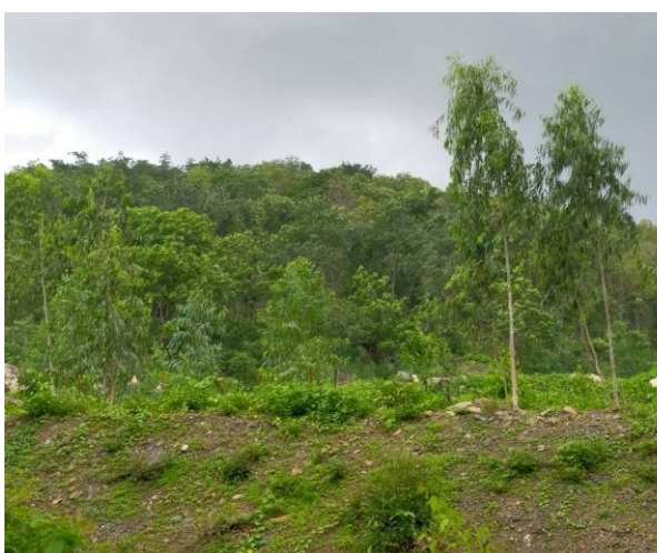
รูปที่ 2-8 การปลูกต้นไม้บนคันทำนบดินของโครงการ