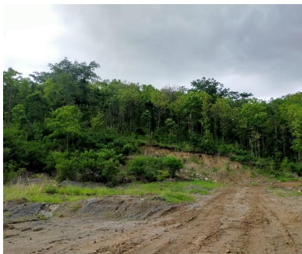
รูปที่ 2-3 การเว้นเขตไม่ทำเหมืองจากเส้นทางสาธารณะ ประโยชน์ทางด้านทิศตะวันตกของประทานบัตร