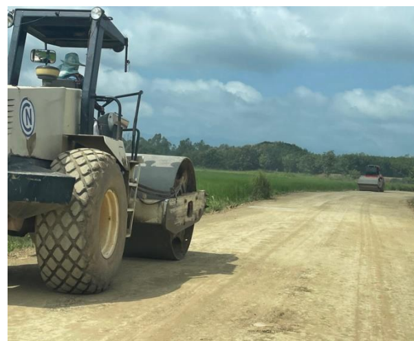
รูปที่ 2-27 กิจกรรมการซ่อมแซมถนนจากกลุ่มเหมือง (ภาพกิจกรรมล่าสุด)