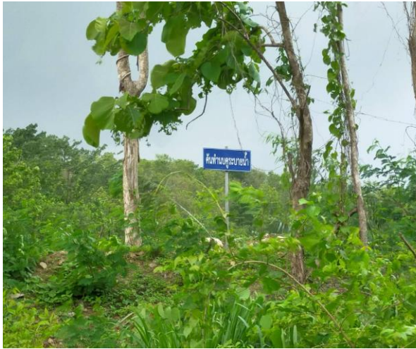
รูปที่ 2-10 คั่นทำนบดินของโครงการ