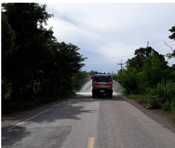
รูปที่ 2-31 การฉีดล้างถนนลาดยางที่เป็นเส้นทาง ขนส่งแร่