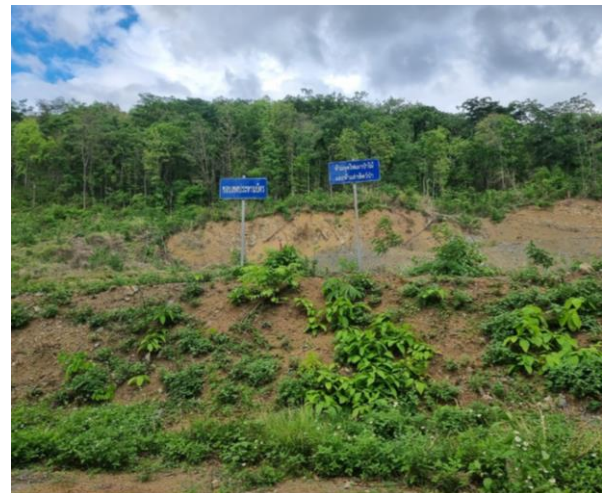
รูปที่ 2-25 ป้ายห้ามตัดต้นไม้ และห้ามล่าสัตว์