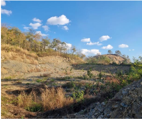
รูปที่ 2-14 การแผ้วถางพื้นที่เฉพาะจุดที่มีการทำเหมือง