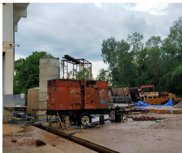
รูปที่ 2-7 โรงซ่อมของโครงการ