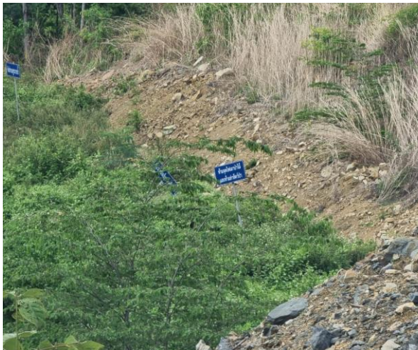
รูปที่ 2-11 รางระบายน้ำ